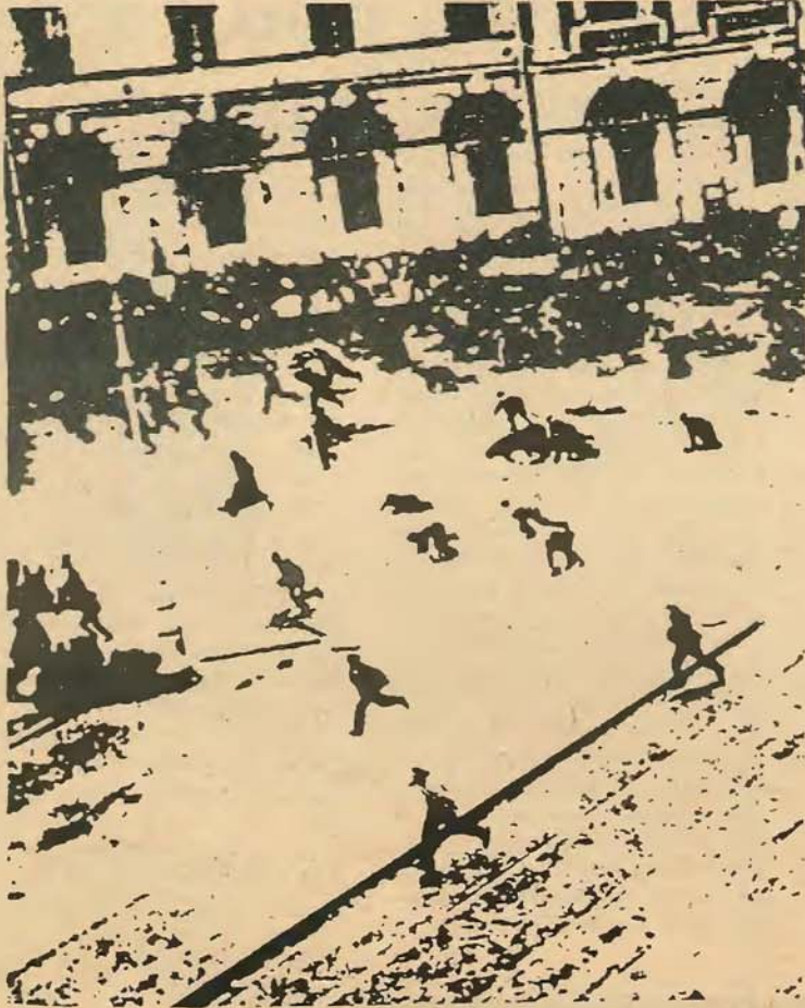
Η σύμπτωση της αλλαγής των περιστάσεων και της ανθρώπινης δραστηριότητας ή αυτοαλλαγής δεν μπορεί να συλληφθεί και να νοηθεί λογικά παρά σαν επαναστατική πράξη.

καπιταλισμού και συγκεκριμένα στο μονοπωλιακό καπιταλισμό τεράστιες πηγές του πλούτου ξοδεύονται σε μη παραγωγικά έργα όπως είναι η διαφήμιση.